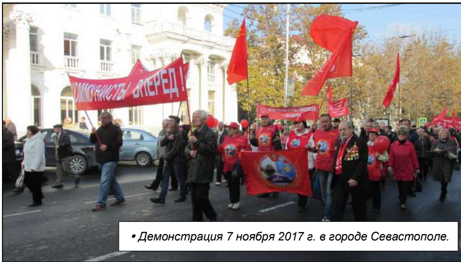
• Демонстрация 7 ноября 2017 г. в городе Севастополе.